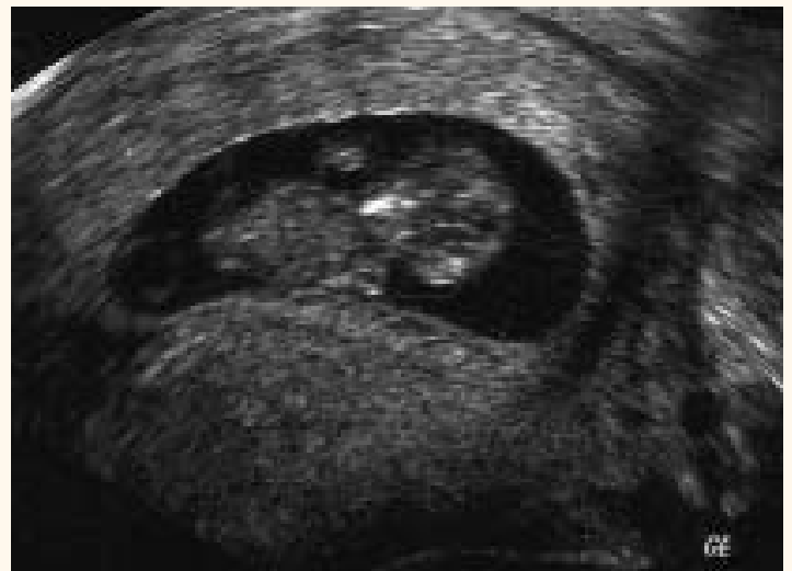
Ultraschallbild in der 11. Schwangerschaftswoche