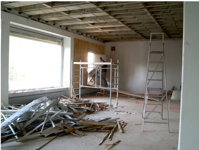
50 ... über eine Rampe durch eine Maueröffnung im ehemaligen K 5...