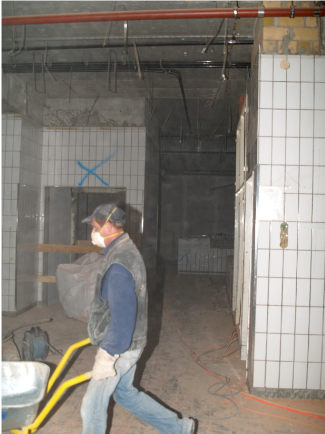
...der durch die Ruinen der Küche...