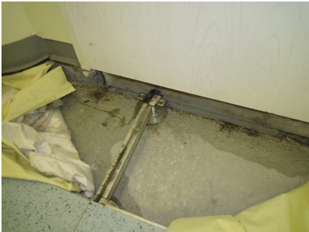
Wasserschäden haben fast immer eine Ursache, die ein Dritter verursacht hat und sind daher nur selten auf Gewährleistungsmängel zurückzuführen.